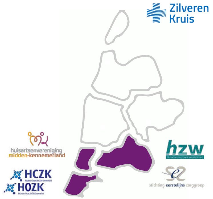
Huisartsen- en zorgorganisaties Noord-Holland Zuid

In de regio Noord-Holland Zuid heeft ZONH haar rol als partner voor de eerstelijnszorg en het sociaal domein verder uitgebreid. Die rol komt tot uiting in mooie trajecten, zoals bijvoorbeeld de ondersteuning van de ontwikkeling van de samenwerking van huisartsenzorg in Midden-Kennemerland met Zuid-Kennemerland en het kwartiermakerschap in Zaanstreek-Waterland. Daarnaast is ZONH in 2020 in gesprek gegaan met paramedici in de regio voor het verkennen van kansen en mogelijkheden voor een sterke organisatiegraad van deze beroepsgroepen. Ten slotte is de rol van ZONH als verbinder tussen de medische eerstelijns- en tweedelijnszorg en het sociaal domein verder bestendigd. De samenwerking tussen de verschillende domeinen en aansluiting op het sociaal domein is essentieel voor het verlenen van de juiste zorg op de juiste plek.